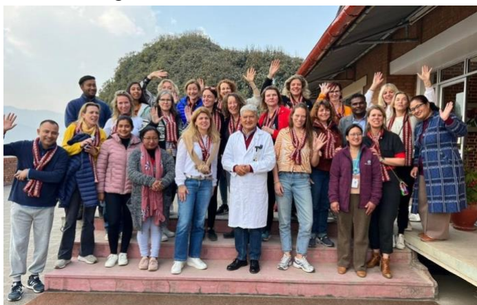
Foto: Female Leadership Journey bij partner Dhulikhel in Nepal 2023

De Female Leadership Journey (FLJ) is een belangrijke reis die MvM ieder jaar organiseert in samenwerking met onze partner Lab voor Leiders en Namasté Reizen. Naast de persoonlijke leiderschapstraining, ontmoeten de deelnemers ook een groep vrouwen van een van de projecten van MvM. In 2023 ging de reis naar Nepal waar de deelnemers een aantal vrouwen van microkredietprojecten ontmoetten via partner Dhulikhel, die een mooi bezoekprogramma had samengesteld.