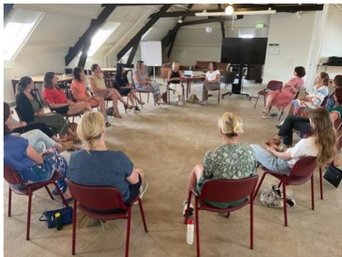
Foto: vrijwilligersdag juni 2023

We zijn trots op onze e-NPS (vrijwilligers-Net Promotor Score) van 50!