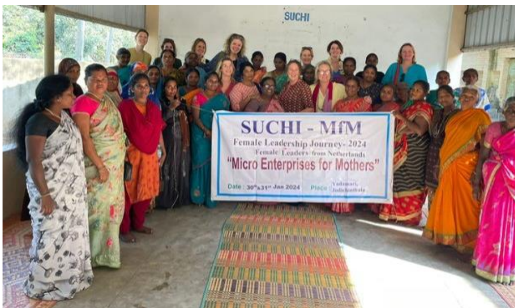
Foto: Female Leadership Journey bij partner Suchi in India 2024

De Female Leadership Journey (FLJ) is een belangrijke reis die MvM ieder jaar organiseert in samenwerking met onze partner Lab voor Leiders en Namasté Reizen. Naast de persoonlijke leiderschapstraining ontmoeten de deelnemers ook een groep vrouwen van een van de projecten van MvM. In februari 2024 ging de reis naar India waar de 8 deelnemers een aantal vrouwen van microkredietprojecten ontmoetten via partner Suchi, die een mooi bezoekprogramma had samengesteld.